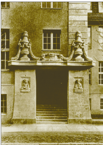
Ab 1925 kam der Peterfitzer Ring in die Museumsräume des Kolberger Lyzeums (hier der Eingang).

Fast 50 Jahre lag er – mehr oder weniger beachtet – in Lübeck, der Goldene Ring von Peterfitz. Er lag hier sogar in zweifacher Ausführung: Das Original im Tresor der Deutschen Bank, die Kopie zunächst sichtbar im Rathaus, dann ebenfalls im Tresor. Ende des letzten Jahres hat der Goldene Ring von Peterfitz Lübeck verlassen – Anlaß genug, seine spannende, wechselvolle Geschichte voller Kuriositäten noch einmal Revue passieren zu lassen. Eine Geschichte, die nicht nur die Völkerwanderungszeit widerspiegelt, sondern auch das 20. Jahrhundert,