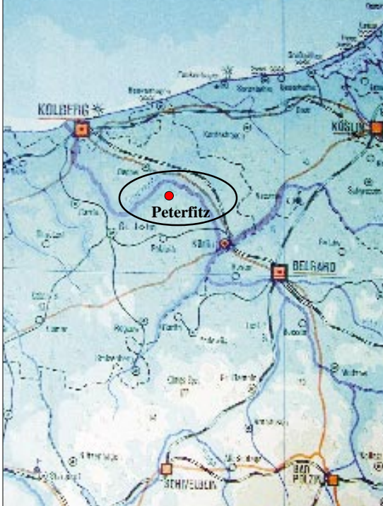
Ausschnitt der Schulwandkarte von Ernst Zahnaw. Peterfitz wurde von der Redaktion eingetragen.

grube zu holen. Der Knecht gräbt und findet an einer Stelle, an der die Erde dunkler ist, ein paar Scherben und einen Metallring. Solche Metallringe werden in der Gegend öfter gefunden, und weil der Ring schmutzig und grau ist, hängt er ihn an den Wagen, auf die Runge – und dort bleibt er ersteinmal ein paar Tage hängen. Dann wird das Stück dem Gastwirt gezeigt, der schaut es sich an, findet nichts Interessantes daran und wirft das Stück auf den Altmetallhaufen. Glücklicherweise benötigt er nun wiederum einige Tage später einen Ring in der Gaststube, erinnert sich, findet den Ring, und nun hängt dieser an einem Nagel an der Thekenseite, und das für die nächsten Jahre.